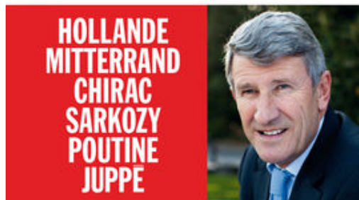
Philippe de Villiers

Le désastre ne peut plus être maquillé. Partout monte, chez les Français, le sentiment de dépossession. Nous sommes entrés dans le temps où l'imposture n'a plus ni ressource ni réserve. La classe politique va connaître le chaos. Il n'y a plus ni précaution à prendre ni personne à ménager. Il faut que les Français sachent. En conscience, j'ai jugé que le moment était venu de dire ce que j'ai vu. »